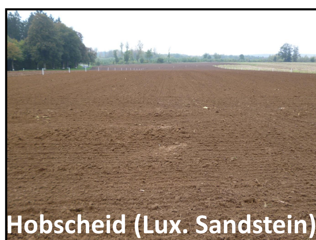
Standorte 2015 FILL-EFFO Projekt